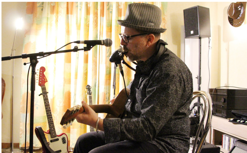
Bo Weavil / D.R.

Nous organiserons comme chaque année d'autres rencontres/concerts dans les différents lieux : centres sociaux, associations locales, médiathèques, collèges et lycées.